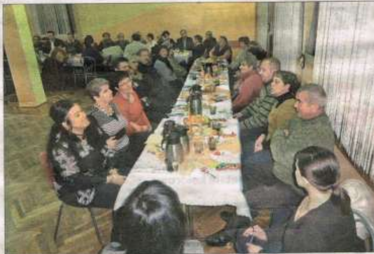
Spotkanie dla babć i dziadków w Dytmarowie